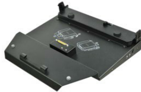
Док-станция для офиса с сетевым адаптером