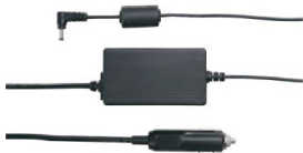
Адаптер для автомобиля (11-24В DC 90Вт)