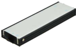
Быстросъемная корзина с SSD накопителем 256ГБ - 2ТБ PCIE