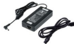
Адаптер питания на 120 Вт с VGA NVIDIA