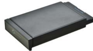
Запасная основная батарея